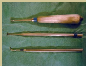
Figura 4. Limpiadores de sarro supragingivales.