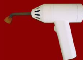
Figura 6. Lámpara de polimerización.