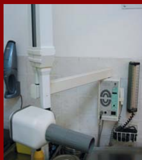
Figura 9. Equipo rayos X dental.