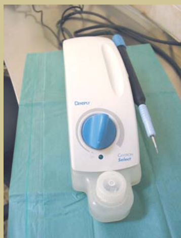
Figura 1. Limpiador dental por ultrasonidos.