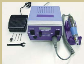
Figura 5. Micromotor.