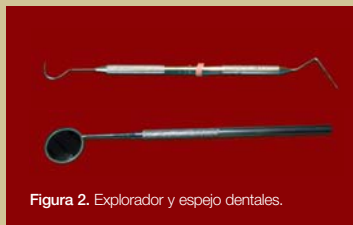
Figura 2. Explorador y espejo dentales.