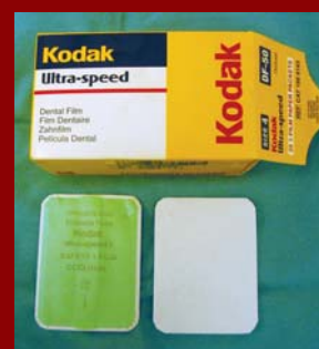
Figura 10. Películas radiográficas dentales.