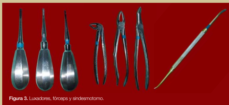
Figura 3. Luxadores, fórceps y sindesmotomo.