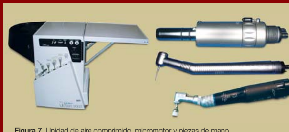
Figura 7. Unidad de aire comprimido, micromotor y piezas de mano.